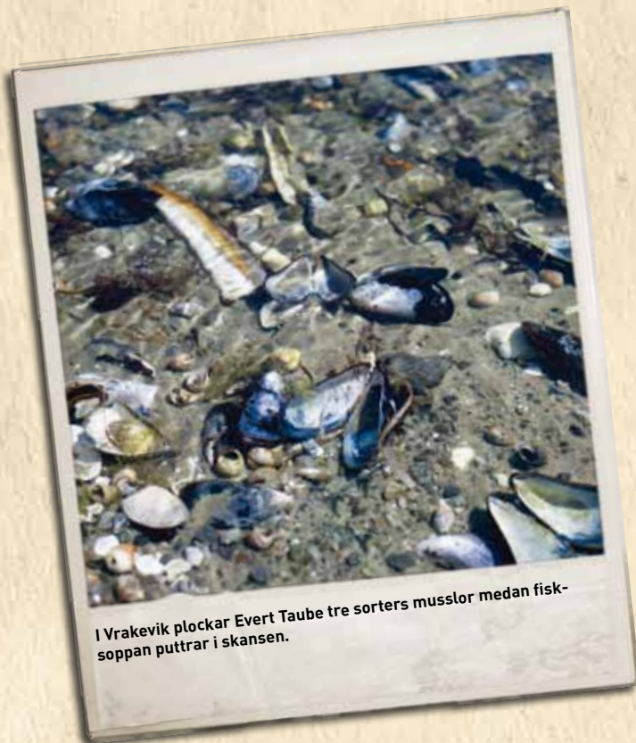
I Vrakevik plockar Evert Taube tre sorters musslor medan fisk-soppa puttrar i skansen.